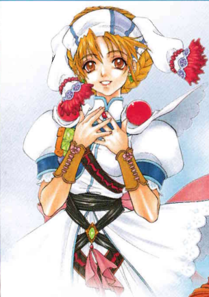
「エレナ」 CV:小西 寛子

『グラナスの歌姫』と呼ばれているが、実際は歌が上手なだけの神官見習い。困っている人や神官の世話まで焼く相当なおせっかい。歌うことで、人の心から闇を払い、光を取り戻したいと思っている。