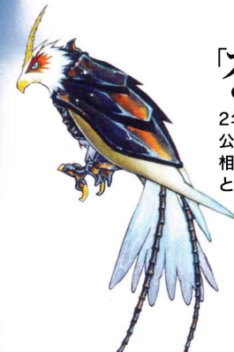
「スカイ」 CV:堀 之紀

2年前から一緒に旅をしている、公私に渡るリュードの頼もしい相棒。言葉を理解し、しゃべることもできる。