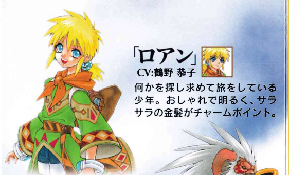
「ロアン」 CV:鶴野 恭子

何かを探し求めて旅をしている少年。おしゃれて明るく、サラサラの金髪がチャームポイント。