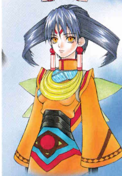
「ティオ」 CV:岩男 潤子

自分の村を襲った邪悪な敵を探し求め続ける獣人。自然の流れから感じとったことを行動の基準にしている。