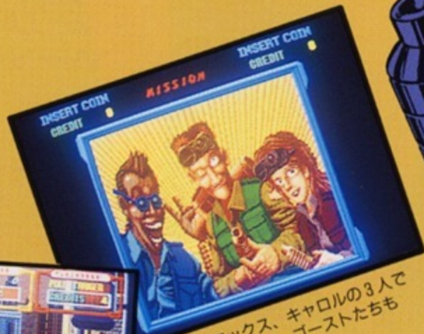
▲ビル、マックス、キャロルの3人で協力して戦えば、ゴーストたちも残らず退散だ!