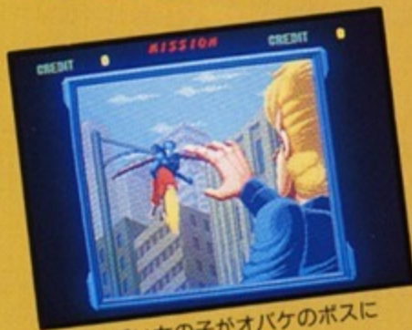
▲可愛い女の子がオバケのホスにつれ去られてしまった!