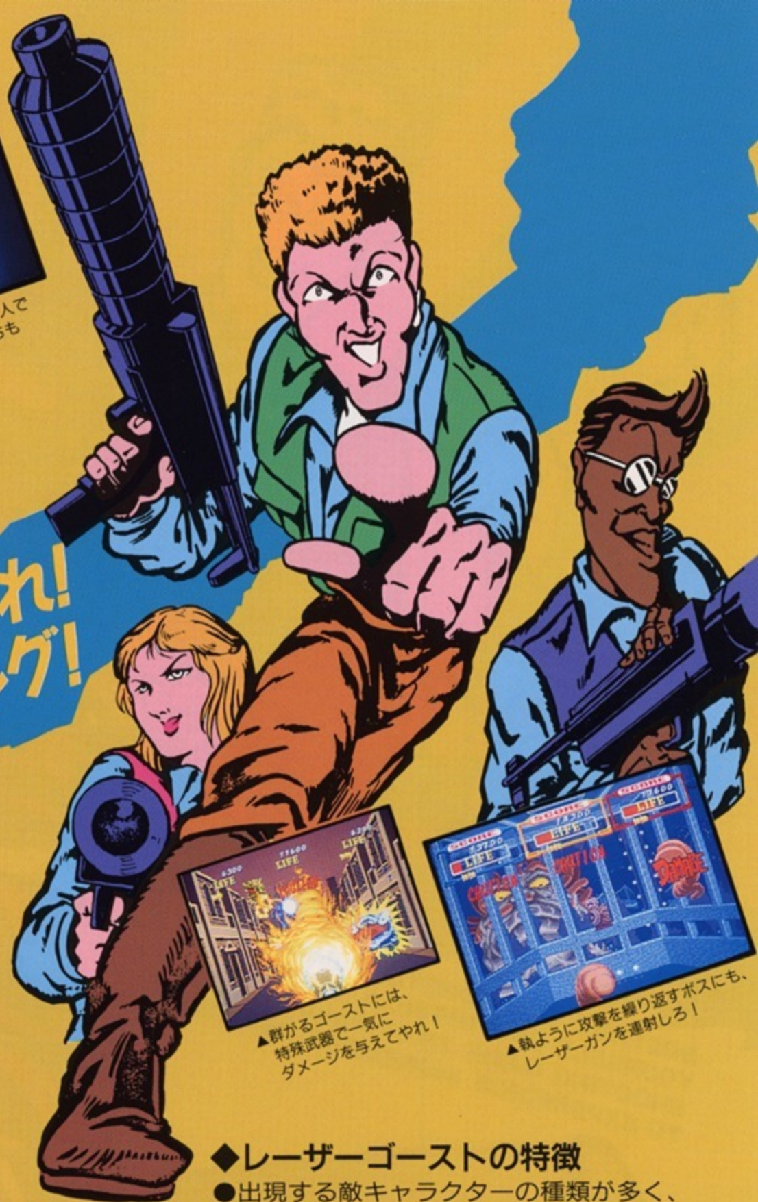
▲群がるゴーストには、特殊武器で一気にダメージを与えてやれ!