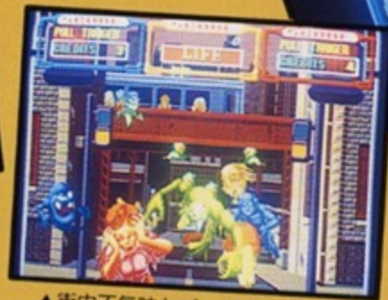
▲街中不気味なゴーストだらけだ。レーザーガンを撃ちまくれ!