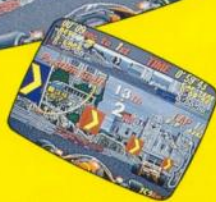
ステアリング・ギアチェンジシステム