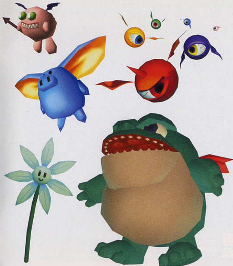
ステージ1ボス “ゲボゲボ”